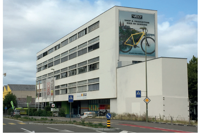
Ansicht Reinacherstrasse Süd