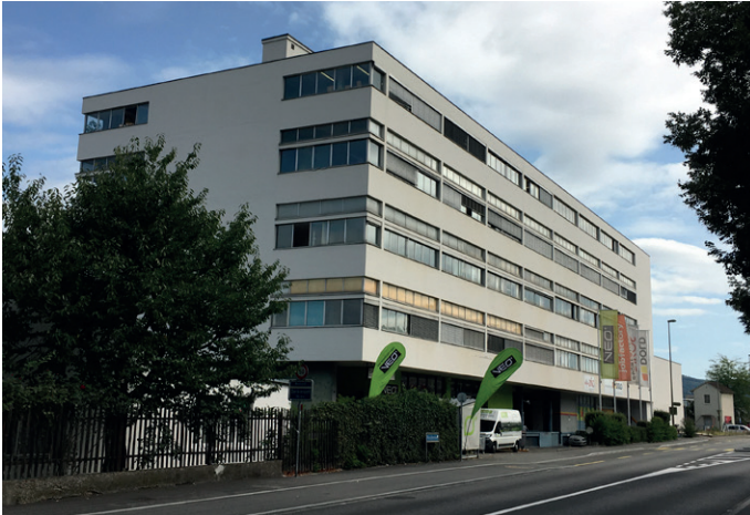
Ansicht Reinacherstrasse Nord

Die interessanten Räumlichkeiten sind ideal für Einzelunternehmer, Kleinunternehmer und Start-ups.