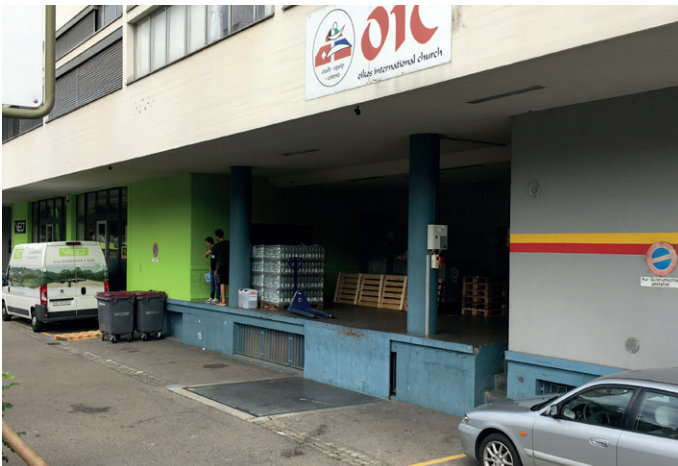
Laderampe mit Hebebühne