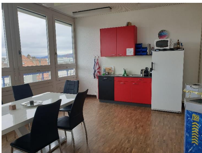
Küche 3. Stock