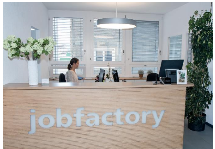
Empfangstheke 1. Stock